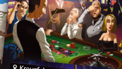
Casino | Kaszinó