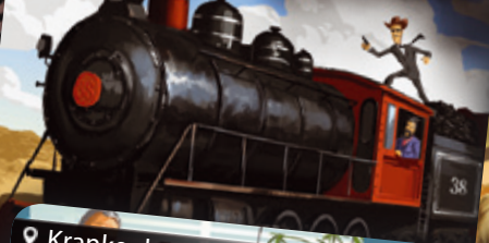
Dampflokomotive | Gőzmozdony