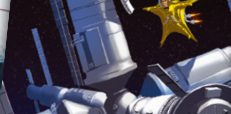
Weltraumstation | Űrállomás