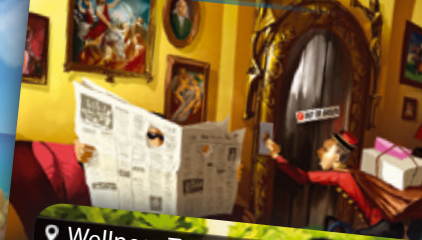
Hotel | Szálloda