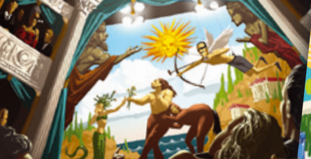
Theater | Színház