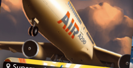
Flugzeug | Repülőgép