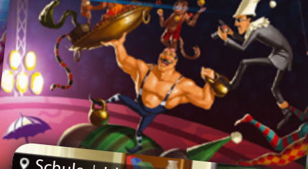
Zirkus | Cirkusz