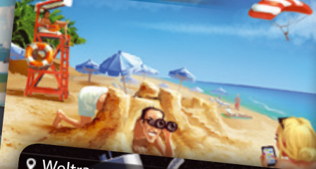
Strand | Strand