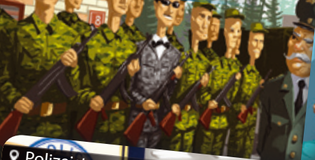
Militärbasis | Katonai bázis