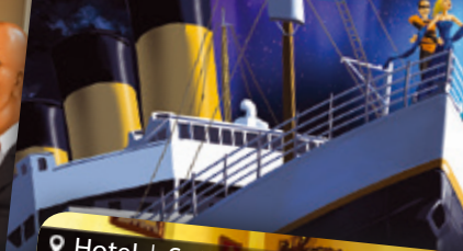
Kreuzfahrtschiff | Óceánjáró