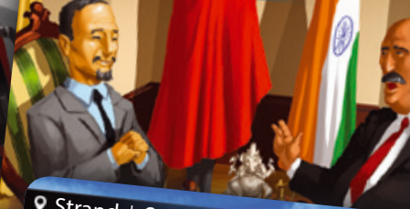
Botschaft | Nagykövetség