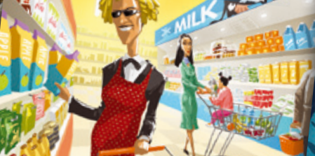
Supermarkt | Szupermarket