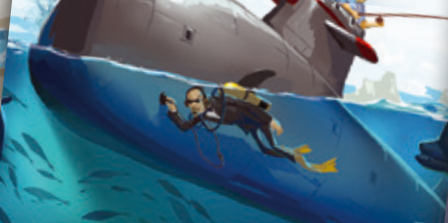
U-Boot | Tengeralttjáró