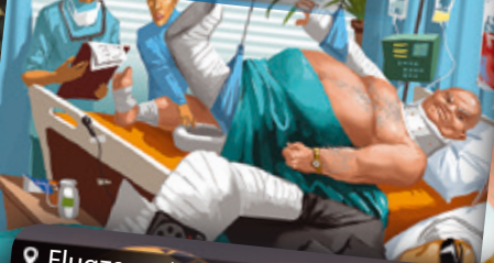
Krankenhaus | Kórház