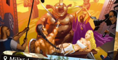
Filmstudio | Filmstúdió