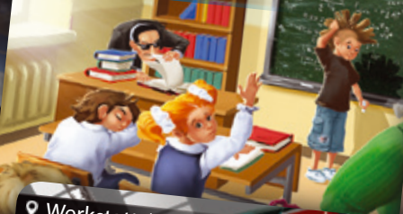
Schule | Iskola