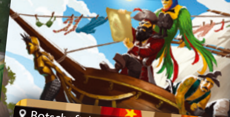
Piratenschiff | Kalózhajó