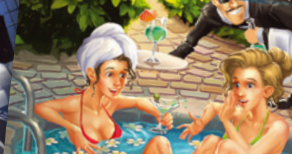
Wellness-Tempel | Wellness-közp.