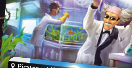
Universität | Egyetem